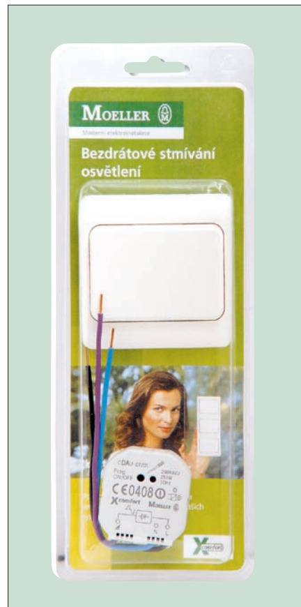
Obr. 6. Sada pro stmívání osvětlení Moeller

tory, kotel, bojler na ohřev vody, směšovací ventily a zónové vytápění prostorů. K pro- gramování jednotky je určen program MMRF (Moeller Manager RF). Dodávku a parametri- zaci Home Manageru zajišťují systémoví part- něři firmy Moeller. Novinkou (obr. 6) jsou také sady pro stmívání osvětlení (SPAD-00/16) nebo spínání osvětlení (SPAD-00/15) či jiných spotřebičů, které jsou k dostání za výhodné ceny ve velkoobchodech.