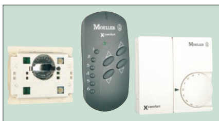
Obr. 2. Senzory – přístroje napájené baterií

principu sběrnice. Jejich společným znakem je rozdělení funkce klasického vypínače na řídicí a ovládací část – senzor (pro uživatele je reprezentován kolébkou vypínače) a výkonovou část – aktor (zajišťuje sepnutí obvodu spotřebiče). Velkou výhodou při projektování těchto systémů je skutečnost, že není zapotřebí přesně definovat, která svítidla či jiné spotřebiče mají být z daného místa ovládány. Dů-