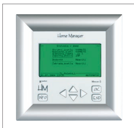
Obr. 5. Obrazovka vizualizace - Home Manager

Jestliže uživatel klade na elektroinstalaci pouze standardní požadavky (tj. dálkové ovládní osvětlení, řízení rolet, spínání libo- volných spotřebičů apod.) a nevyžaduje např. časové funkce, světelné scény, komfortní re- gulaci vytápění apod., lze systém nastavit snadno pouze šroubovákem (obr. 4). Při pro- gramování se nejprve na ak- toru stiskne pro- gramovací tlačítko (na ak- toru se rozsvítí di- oda LED a připojené osvětlení), dále požá- dovaný vypínač (jeden nebo více), který má ovládat zvolený ak- tor, a pro ukončení pro- gramovacího režimu se opět šroubovákem stisk- ne programovací tlačítko na ak- toru. Je to jed- noduché a rychlé, bez sekání zdi, bez výměny kabeláže či zvláštních znalostí systému.