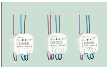
Obr. 1. Výkonové členy – spínací, roletové a stmívací aktory systému RF

Všeobecný rostoucí trend využívání automatizace v domácnostech a v kancelářích se zatím příliš neprojevuje v elektroinstalaci budov. Přitom určitě častěji saháme na vypínač osvětlení než na ovladač videorekordéru. Od elektroinstalace vlastně neočekáváme, že by se přizpůsobovala našim požadavkům tak jako třeba ovládání televizoru. Jsme zvyklí večer než usneme vstát z postele a zhasnout světla. Příjemnou pohodu ke sledování tele-